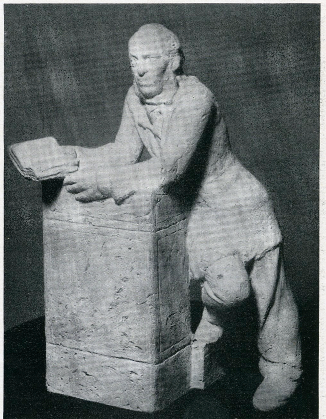
Hans W. Larsen: Kresten Kold.