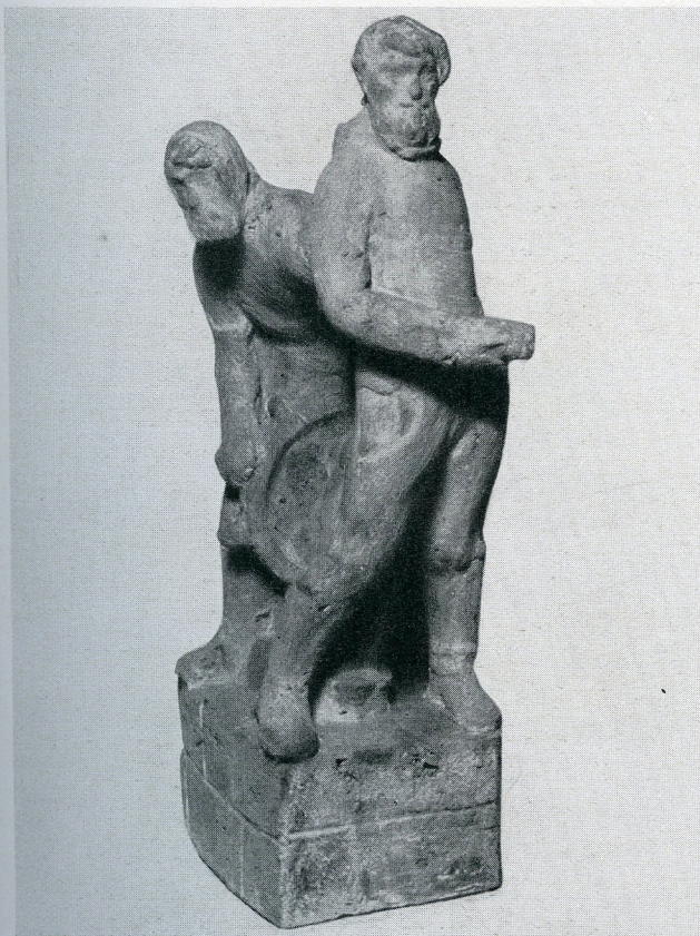
Hans W. Larsen: Vitus Beering Mindesmærke.