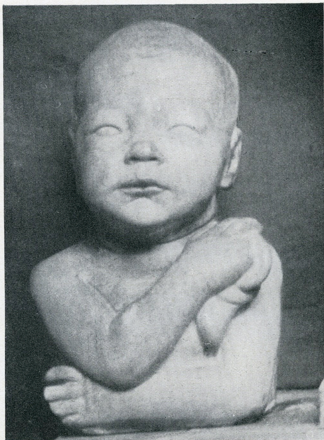
Hans W. Larsen: Barnebuste.