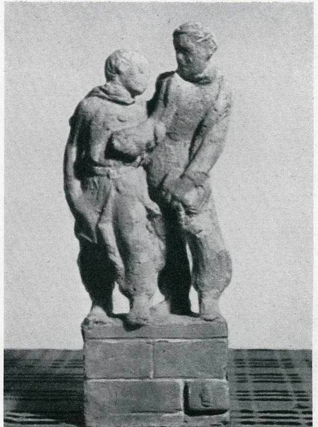
Hans W. Larsen: Skoledrenge.