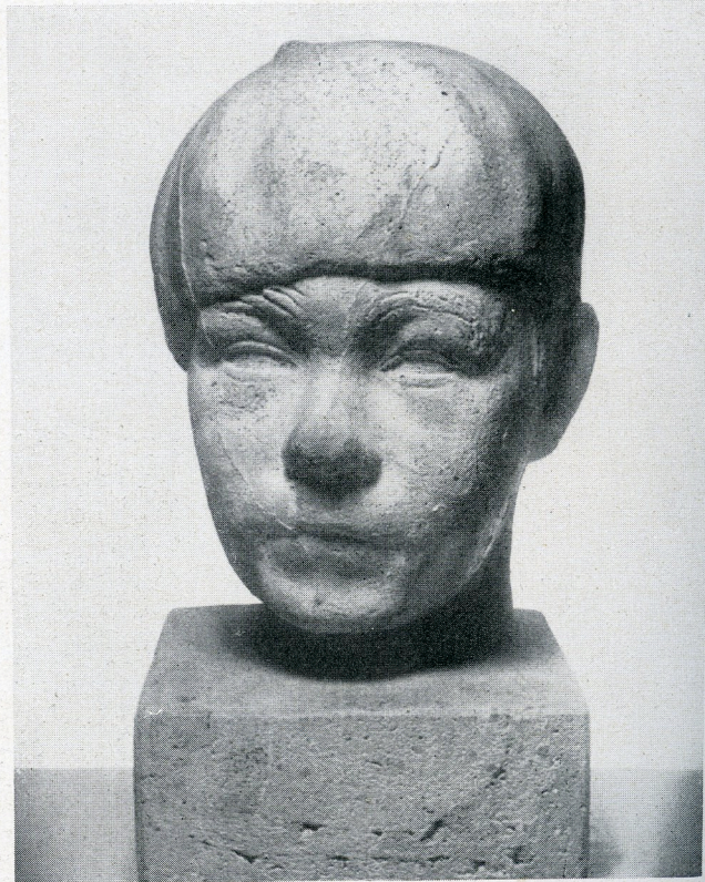
Hans W. Larsen: Drenggehoved.