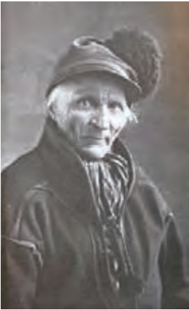
Et udateret portrætfoto af Johan Turi. Kiruna.