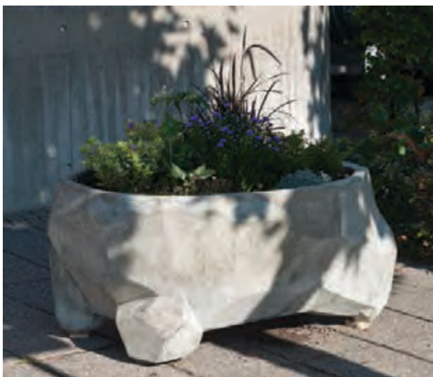
Den første af de store blomsterkummer til bymidten i Vejen er nu firt tilplantet og har fået plads ved rådhuset.