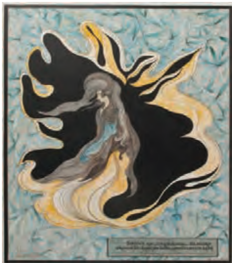
Sakuntala-tegningen har tilhørt billedhugger Rudolph Tegner, og blev for mange år siden solgt af hans enke til den nuværende ejers far. Tegning i tusch og akvarel kan ses i udstillingen til den 16. november.