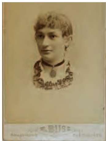
Komponisten Carl Nielsen og maleren Emilie Demant Hatt - begge fotograferet i København i 1888.