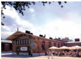
Udvandrermuseet BallinStadt ved Hamburg.