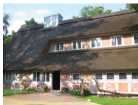
Otto Modersohns Museum, Fischerhude