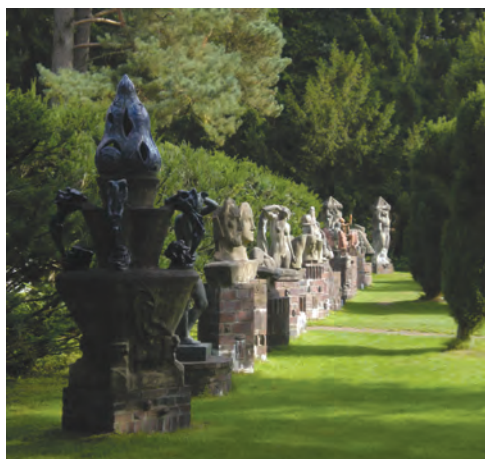
Bossard Kunststätte, Jesteburg