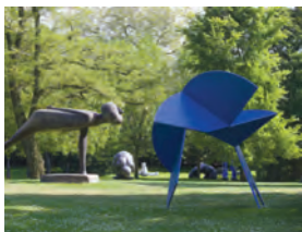
Kunstwerke Carlshütte, Büdelsdorf