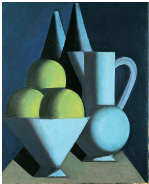
Vilhelm Lundstrøm (1893-1950) "Nature Morte". 1930. Olie på lærred, 100 x 80,3 cm. ARoS - Århus Kunstmuseum, inv. nr. 0575.