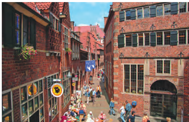
Böttcherstrasse i Bremen.