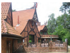
"Kaffee Verrückt", Worpswede

09.00 Afgang med bus til Worpswede. Vi har nu en hel dag i Worpswede. Vi kører til "Kaffee Verrückt", hvor vi starter med en rundvisning. Så kan vi på egen hånd bl.a. at besøge følgende museer: Grosse Kunstschau Worpswede, Worpsweder Kunsthalle, Käseglocke, Museum am Modersohn Haus. Worpswede er fyldt med hyggelige gallerier, butikker og spise-