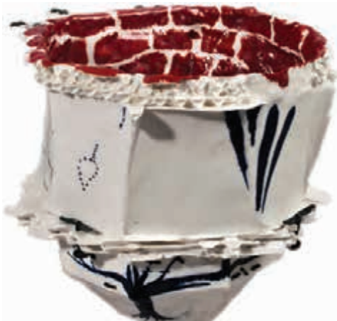
I foråret er Sophus Ejler Jepsens 15 cm høje vase fra 2011 købt til samlingen. Den består af porcelæn med soldaterben og hæfteklammer.

Vinterferieværksted for børn og voksne på Vejen Kunstmuseums billedskoleloft. Alle er velkomne.