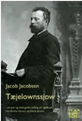
Bogen til 75 kr. pr. stk. forhandles kun på Vejen Kunstmuseum.