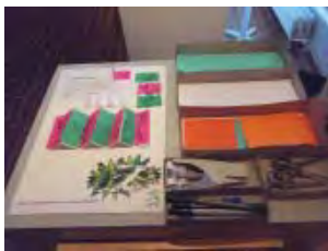
Bevæbnet med papir og en klipsemaskine kunne man ved en af posterne lave harmonikabilleder.

det tidlige efterår kan nysgerrige i alle aldre prøve apparatet af. Først i maj var en hollandsk familie på besøg og udbrød begejstret, at sådan én ville de da også have derhjemme!