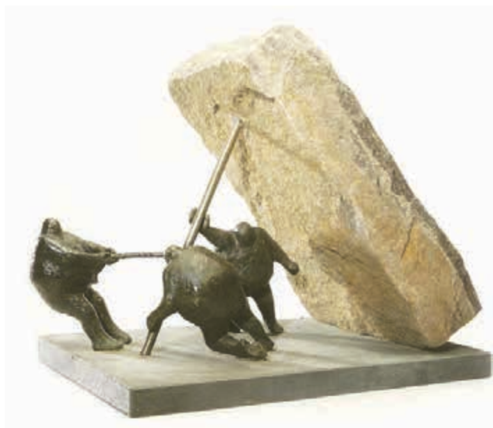
Skulptur af Keld Moseholm

Når du har reserveret plads i bussen, indbetales depositum på 250 kr. til Kunstforeningens konto: reg. nr. 1551 kontonr: 8715633851 Restbeløbet betales senest 1. august 2014.