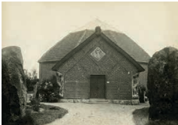
Dette foto af Niels Hansen Jacobsens atelier-museum ved Skibelund Krat er nok taget en gang inden 1924, da man den 1. juli åbnede hans museum i Vejen.