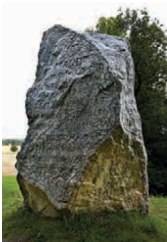
Niels Hansen Jacobsen har udført Genforeningsstenen, der mod øst afrunder Skibelund Krat. Den står på en gammel gravhøj, hvorfra udsigten åbner sig til Kongeåen i dalen nedenfor.

"Skibelund Saga". Her opstod en fest- og mindeplads, hvor det folkelige arbejde blev gjort frem mod 1920-genforeningen, der hylides med Niels Hansen Jacobsens Jellingestens-agtige runeristninger på en sten, der symbolsk er sat på endnu en bronzealderhøj som vestlig afrunding af Skibelund-anlægget.