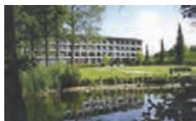
Hotel Maribo Søpark