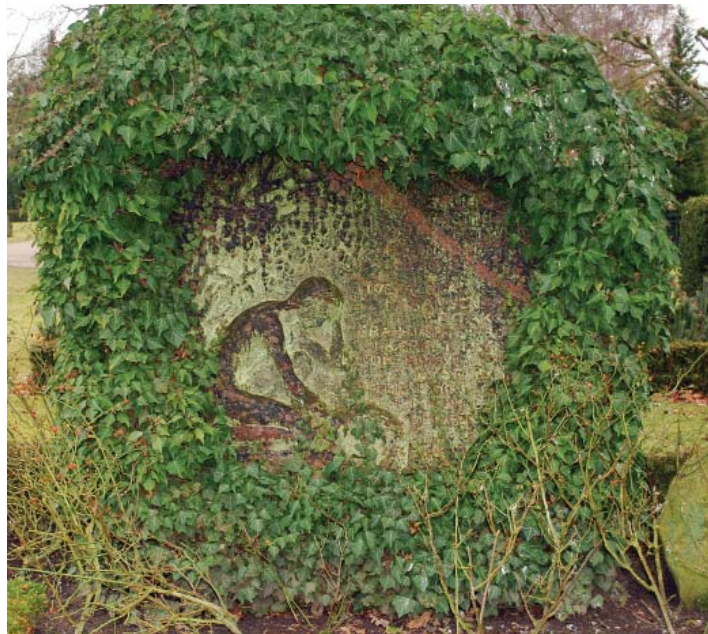
4. Apoteker Mikkelsens gravsten på Assistens Kirkegård i Odense, som den i dag tager sig ud, hvor de skulpturelle elementer må kæmpe med planterankernes slyngværk.

kedes det igen at erhverve tre beslægtede stole til opstilling i salen. Grete og hendes bror havde også Springvandspladsen som legeareal. Kaja har fotograferet dem, som de balancerer på kæderne, foto 3 . De hang omkring springvandet for at holde nysgerrige på afstand af bassinet, hvor tudser og øgler spyttede brandvarmt vand fra elværket. Det skulle ud til afkøling i bassinet.