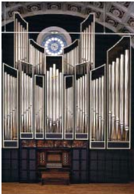
Et sublimt orgel

Kursusvirksomhed og højskole er stadig det primære mål for Esbjerg Højskole, men sideløbende med denne aktivitet har Esbjerg Højskole i de senere år optrappet den såkaldte private udlejning i form af konferencevirksomhed. Esbjerg Højskole råder i dag over konferencsale, biografteater, atriumgård, tv-studier, IT-faciliteter, net cafeer, restauranter og meget mere.