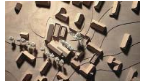
Billedet viser træmodellen af kunstmuseet på Föhr.

Seværdigheder udover det nye kunstmuseum: Dr. Carl-Häberlin-Frisernmuseum i Wyk. St. Johannis Kirke, den største på øen, kaldes friserdomen, fra omkring 1240. Kongemindesmærke for Frederik VI's besøg i 1824, rejst to år efter. ■