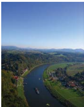
Elben ved Pillnitz.