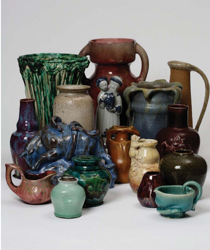
Vejen Kunstmuseums udstilling, "Keramik i lange baner - 120 års dansk keramik", kan ses frem til og med mandag den 1. juni 2009.

Vejen Kunstmuseum hører til blandt de ældre af landets kunstmuseer, og fylder i år 85 år. Åbningsdagen var den 1. juli 1924. Den halvrunde fødselsdag blev dog allerede markeret den 14. marts, da Mads Øvlisen åbnede "Keramik i lange baner" med en tale om om keramikens væsen belyst med bl.a. den japanske keramikker, Shoji Hamadas kloge ord.