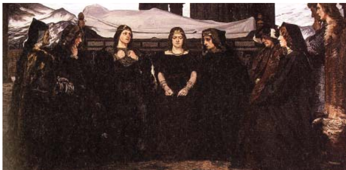
3. Agnes Slott-Møllers maleri "Gudrun ved Sigurds Lig" fra 1901 tilhører Nationalgalleriet i Reykjavik – vises ikke på udstillingen.

hendes værker en interesse for en lang række kvindeskæbner som dronning Margrethe, dronning Dagmar og Agnete.