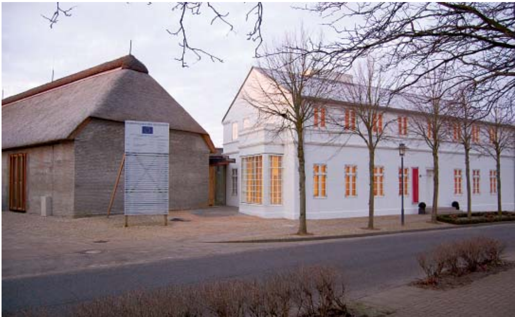
Kunstmuseet på Föhr.