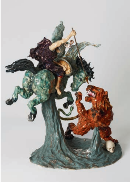
"Bellerophon ridende på Pegasus spidder kimæren (efter Rubens)". 1992. Glaseret stentøj. H 51,5 x 43,5 x 40 cm. Inv. VKV 2167. Overdraget fra Statens Kunstfond i 2005.