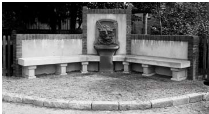
Springvandsmasken, som den tog sig ud i sandsten på Bane-gårdspladsen i Vejen. Bemærk slægtskabet til masken over atelierdøren på fotografiet på modsatte side.