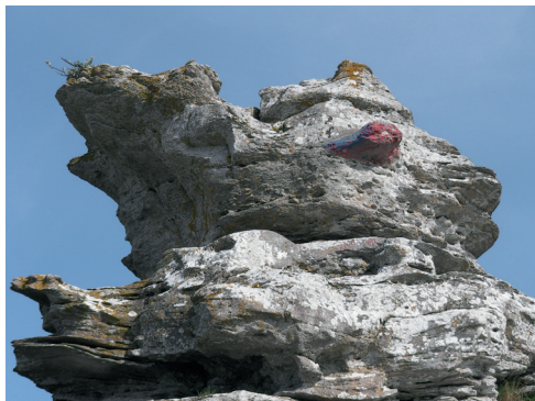
▲ Stenformationer på Gotland.