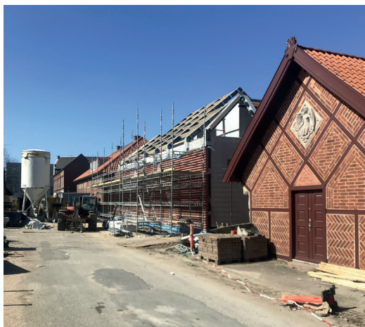
▼ Lindegade i Vejen er forvandlet til en byggeplads. Nybyggeriets sydfacade er nu muret op. Til højre ses indgangspartiet i mukesten og bindingsværk, der oprindeligt blev opført i 1914 ved Skibelund Krat.