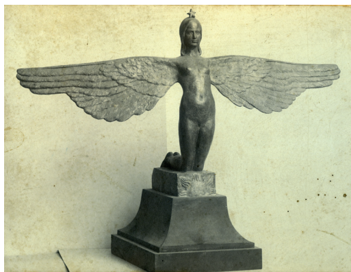
▲ I mange år var det kun billedhuggerens gamle foto af "Morgenrøden", der kunne henvises til.