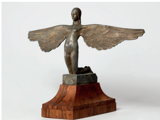
▼ For et par år siden dukkede Niels Hansen Jacobsens statuetteudgave af "Morgenrøden" op i privateje. Det blev muligt at få den fotograferet. Samtidig blev der taget form over statuetten, så den nu kan ses på museet i en hærdet gipsversion.