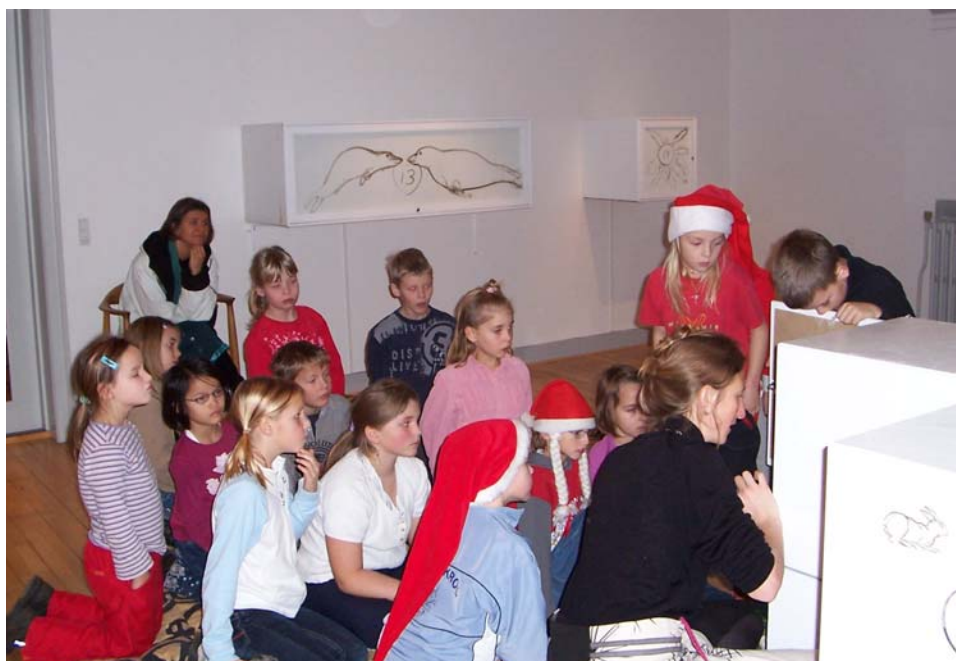
Den 1. december fulgte 2. klasse fra Bække Skole spændt med i åbningen af den første af de 24 kasser i Vejen Kunstmuseums julekalender, der denne gang var fyldt af John Olsen.