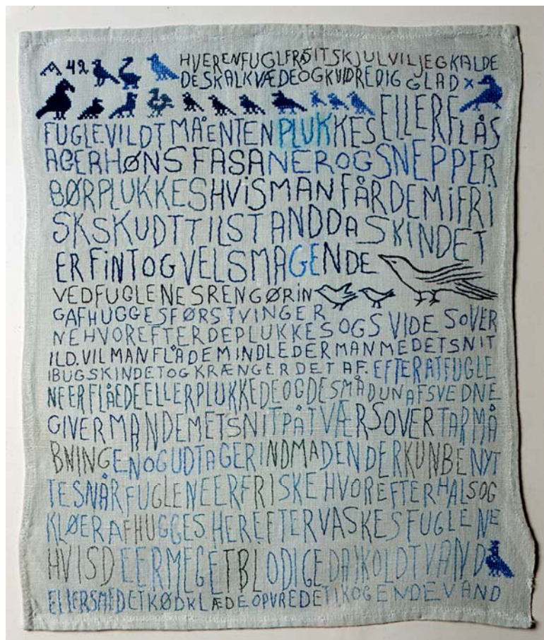
Annette Holdensens broderet viskestykke "Vildfugle" fra serien "Dialog med en kogebog", 2000, 47 x 39,7 cm, kom til samlingen i februar 2005. Inventarnummer nr. VKV

* Inv. VKV 1514 MARTIN MORTENSEN (1874-1949) Skrivesæt. 1912. Glaseret brændtler. Højde 5,8 cm, brede 20, dybde 18,3 cm. Under bunden indridset med sammenslynget monogram MM