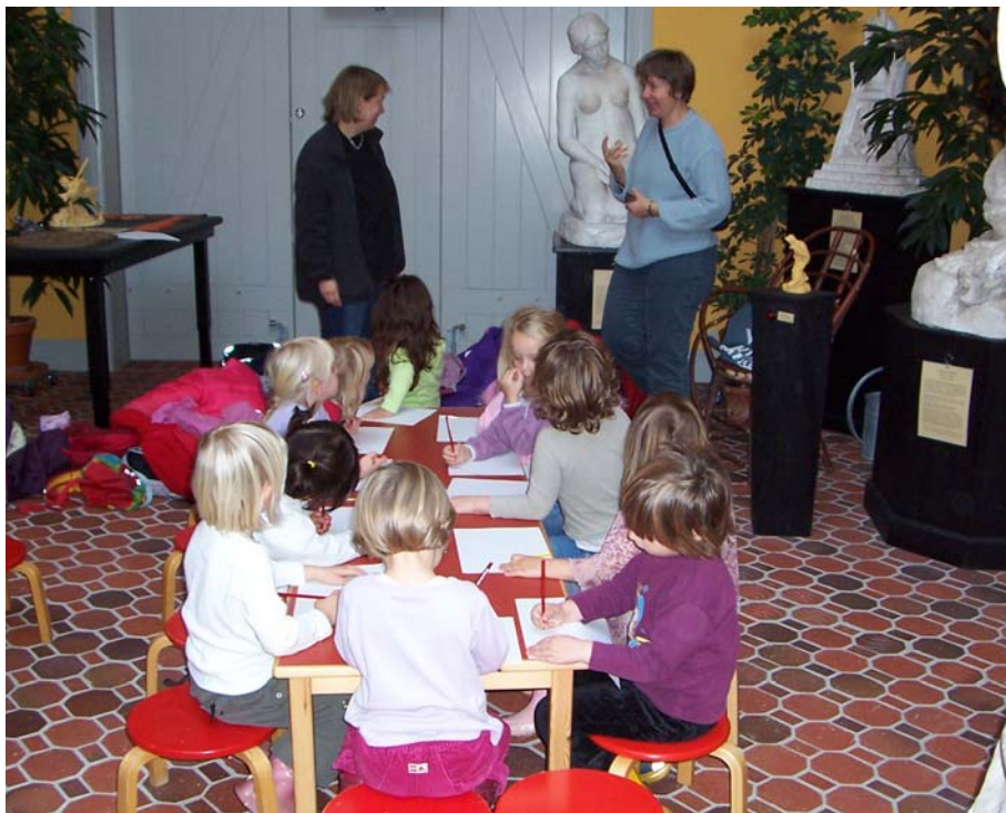
< 24. juni 2005. Her er et hold fra Vorupparkens Børnehave fanget under tegneøvelser i museets skulptursal.

MAJ 3.5. Lindeh. Vamdrup 8 pers., Gruppe fra Christiansfeld 14 pers., 5.3. Rotary Vejen og England 60 pers., 6.4. Østerbyskolen 7 pers., 10.5. 10.5. Sct. Georgsgilderne Ringkøbing 36 pers., 11.5. Folke-dansere fra Haderslev 25 pers. , Møde med Vejen Miniby og foto-klubben 30 pers., Vejen Gymnasi-um 19 pers., Dansk Lægeforening 30 pers., 12.5. Møde i Billedskolen 6 pers., Askov Efterskole 30 pers., 18.5. Odd Fellow 48 pers., 21.5. Trinitatis Menighed 40 pers., 25.5. Øster Linnet Skole 15 pers., 26.5. Antikvarisk Selskab, Ribe 36 pers., 27.5. Vejen Friskole 15.pers.