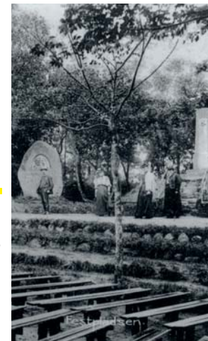
Festpladsen i Skibelund Krat, hvor det første grundlovsmøde blev holdt i 1865 - altså for 150 år siden.