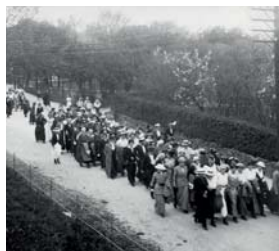
Grundlovsdag 1915 passerer kvinderne torvet i Askov på vej fra højskolen til Skibelund Krat. Mon lige så mange går turen i 2015?

I en historisk gentagelse af optoget opfordres alle, der har lyst til at gå med til at stille i deres hverdagstøj, og gerne vælge sort som i 1915. Sømlængden vil med sikkerhed være en anden, og i dag meget mere individuel!