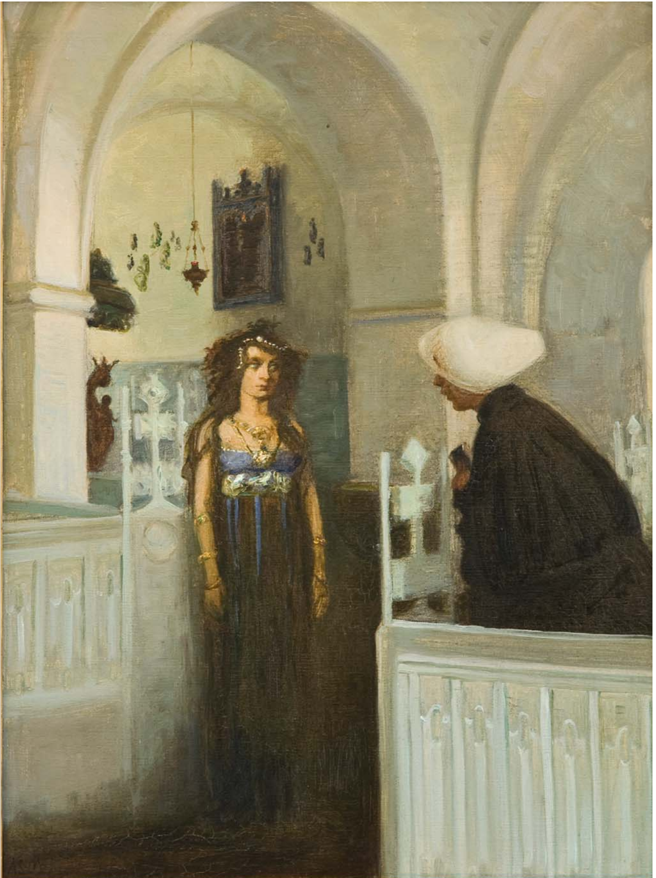
Fig. 6 Agnes Slott-Møller, Agnete , 1892. Olie på lærred, 65,5 x 74 cm. Privateje