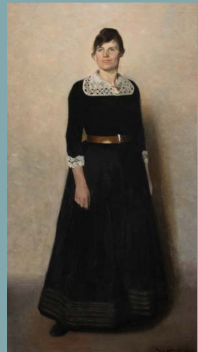
Fig. 3 Harald Slott-Møller, Min Hustru , 1887 Olie på lærred, 187,5 x 102 cm. Fuglsang Kunstmuseum