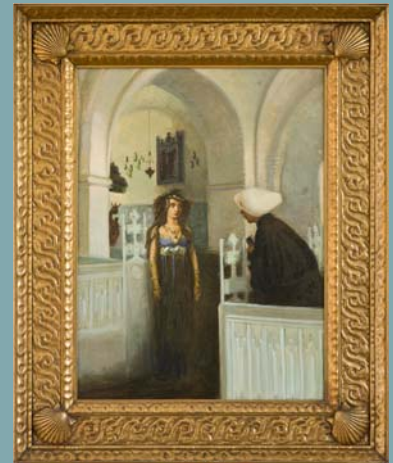
Fig. 6 Agnes Slott-Møller, Agnete , 1892. Olie på lærred, 65,5 x 74 cm. Privateje

Diskuter Agnes Slott-Møllers kunst i forhold til den måde begreberne naturalisme og realisme blev opfattet under det moderne gennembrud.