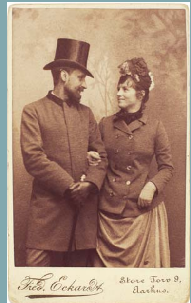
Fig. 2 Harald Slott-Møller og Agnes Rambusch som forlovede, 1888