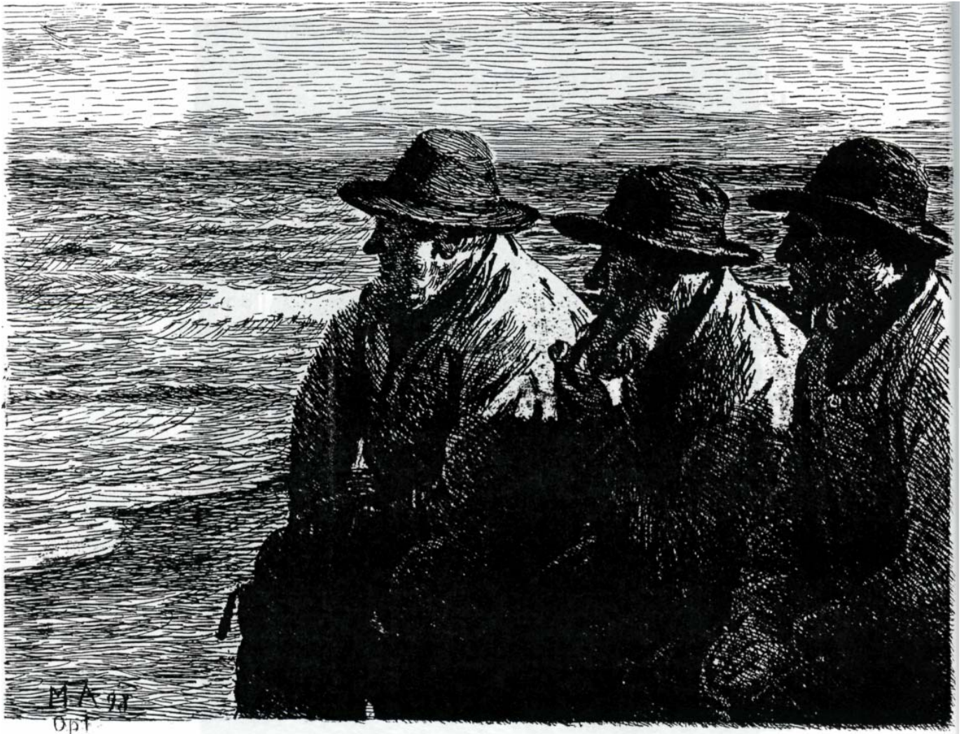
Michael Ancher (1849-1927) Skagen-Fiskere . 1898. Inv. 895.