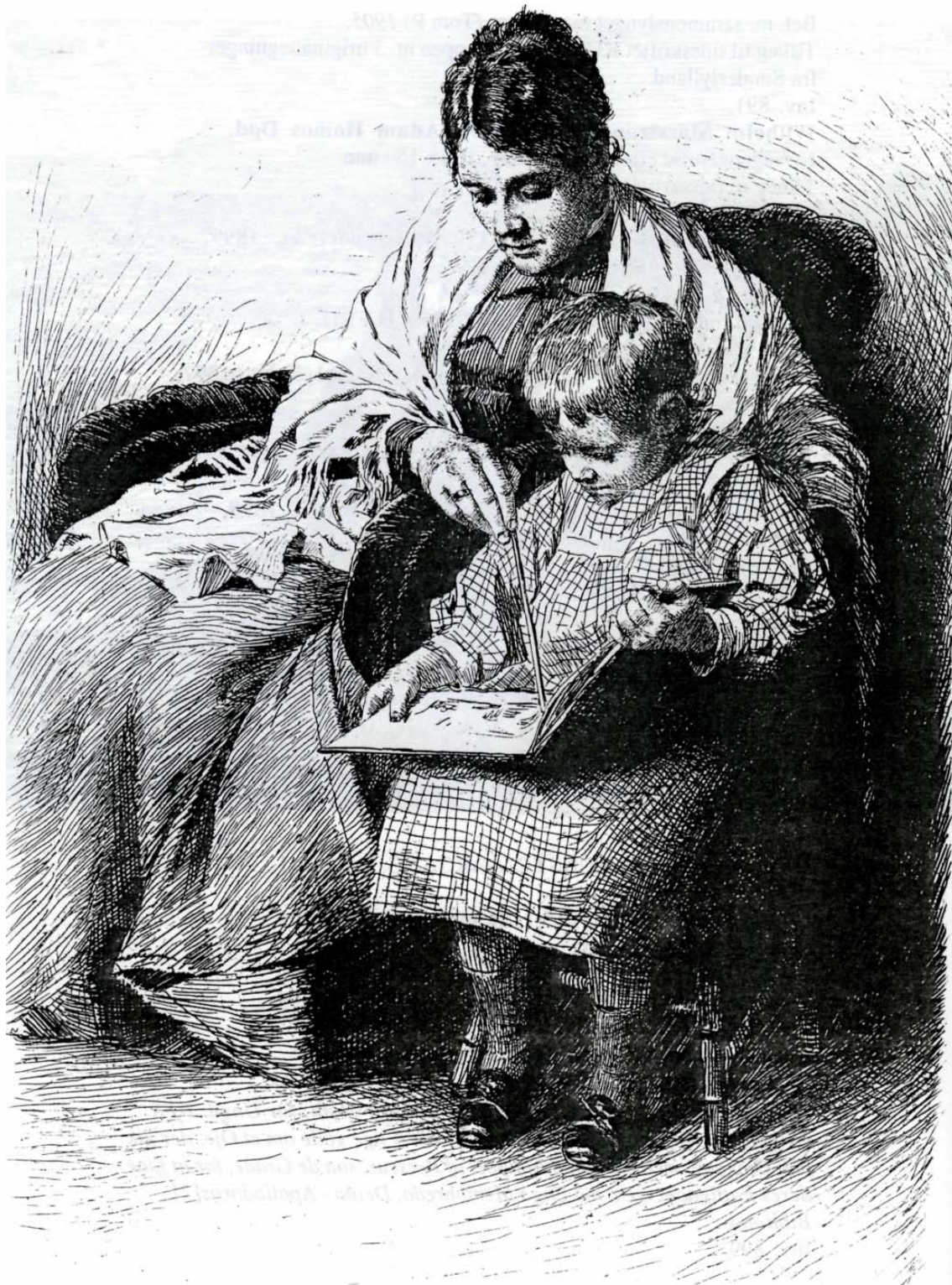
Frantz Henningsen (1850-1908) En Moder med sin lille Pige. 1901. Inv. 902.