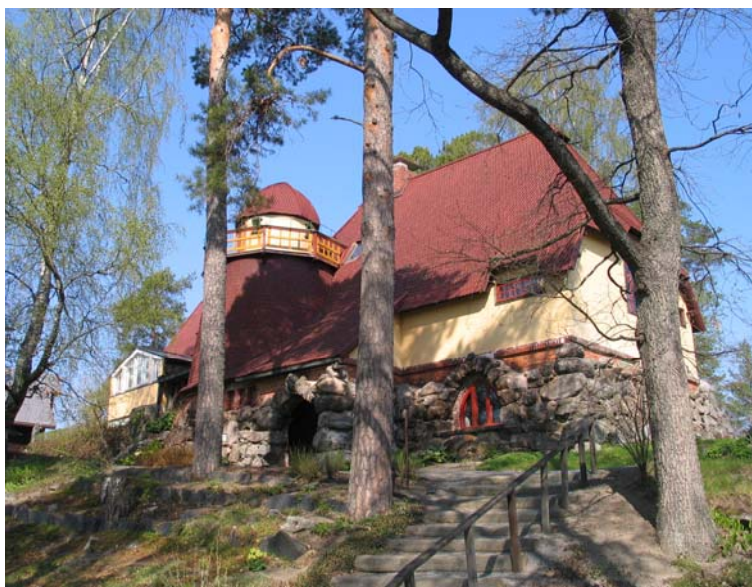
Visavuori, den finske billedhugger Emil Wikströms hjem et par timers kørsel udenfor Helsinki. Her findes tre Hansen Jacobsen værker.