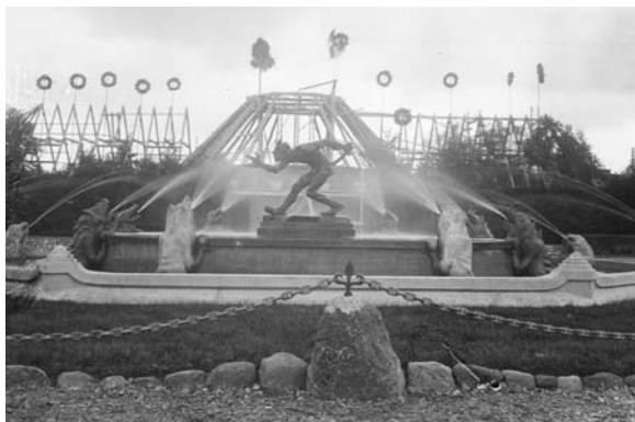
Vejen Kunstmuseum, som bygningen tog sig ud ved rejsegildet i 1924. Troldepringvandet havde Jeppe Aakjær holdt indvielsestale for sommeren 1923