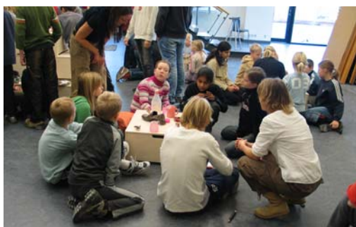
På tværs af tre klasser er man klar til at lytte, tænke og lege i gipsprojektet i Grønvangsskolens nye torvesal.

I forlængelse af årets julekalenderudstilling 2003/2004 med værker af unge elever fra den keramiske afdeling på Kunstakademiet opstod på deres initiativ tanken om at inddrage dem både i en udsmykning af den nye Grønvangsskole, men også at få dem ind i hverdagen på kunstnerbesøg. Den sidstnævnte tanke udviklede sig til et værksted, hvor tre klasser i samspil med fire Akademi elever i løbet af to dage omsatte ½ tons gips!