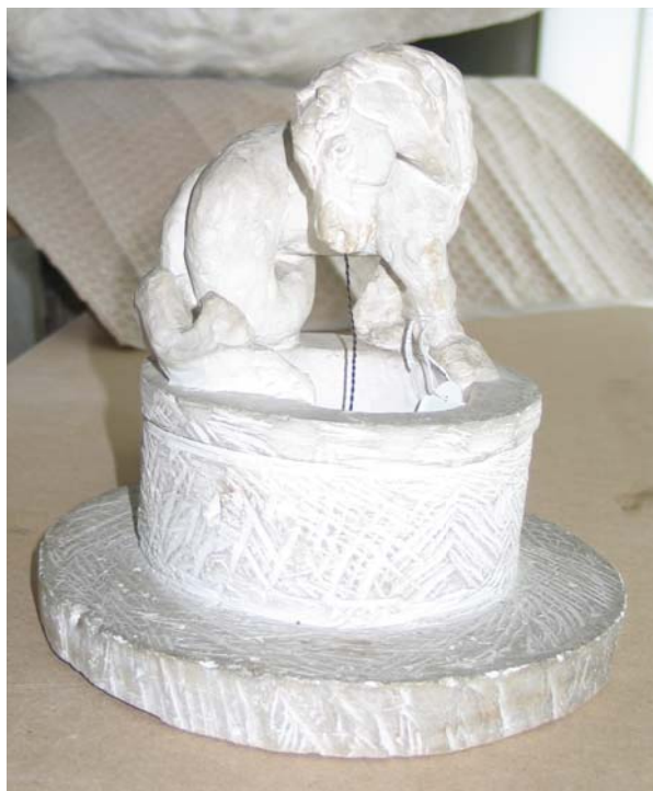
Niels Skovgaards lille, hastige gipsskitse til Havhestbrønden lykkedes det at erhverve på auktion den 2. april 2004.

(formodentlig fra før 1928). Ubrændt ler. 7 x 21 x 18,1 cm. Gave den 25. juli 2004