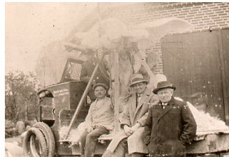
Flytning af "Tiden og Mennesket" i henholdsvis 1924 og 2004. Der er i mellemtiden sket en del med det tekniske hjælpeudstyr!

Styk for styk blev de største skulpturer gradvist savet i stykker, til de nåede en højde, der kunne gå gennem de huller, der stod tilbage efter at den gamle bygnings døre var taget ud. Alt blev lagret i Gallerigangen, og derfra bragt tilbage. Men, i mellemtiden var der kommet nyt gulv og dørene var atter sat i – blot et trin lavere nede. For at skåne salene blev der i stedet lavet hul i Gallerigangens tag, og på et par varme, solrige sommerdage sørgede Vamdrup Specialtransport med indsigt og stor varsomhed for at få alle skulpturerne hejst op og kørt om til Skulptursalens portindgang ud mod Østerrallé.