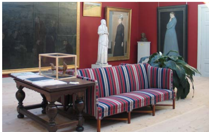
I løbet af 2004 har Vejen Kunstmuseum som deponering bl.a. modtaget Ejnar Nielsens hovedværk, Den Svangre , der til hverdag hænger på Göteborg Konstmuseum og Stephan Sinding's gipsudgave af Slægtens Ældste , der tilhører Ny Carlsberg Glyptotek. Her ses begge i det nordvestlige hjørne af Malerisalen.