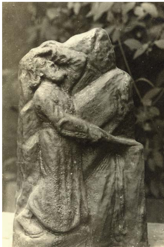
I et af Hansen Jacobsens gamle fotoalbum er bevaret dette foto af en Moses, der slår vand af klippen. Den 2. april 2004 lykkedes det på auktion at erhverve den keramiske statuette.

Inv. VKV 1465 NIELS HANSEN JACOBSEN (1861-1941) Vase . Udateret. Glaseret stentøj. Højde 14,1 cm. Dia. 11,5 cm. Gave marts 2004