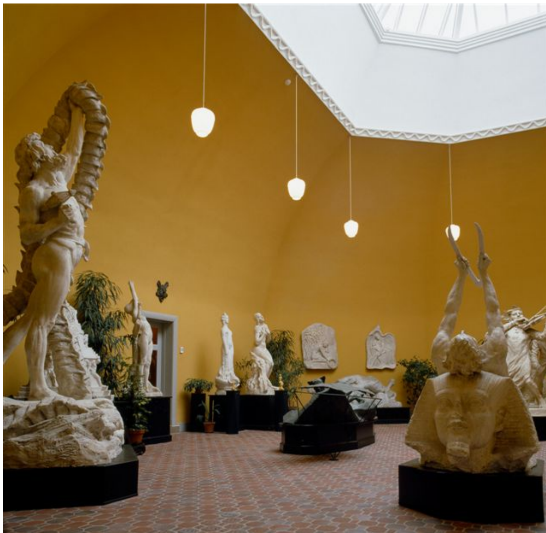
Vejle Kunstmuseums Skulptursal efter endt renovering, oktober 2004. Væggene er ført tilbage til deres oprindelige gule tone, gulvet er hævet, isoleret, og der er i belægningen indfældet et reliefspor for blinde og svagtseende. Bemærk de specialfremstillede 8-kantede klinker fra Gørding Teglværk har samme proportioner som rummets grundplan.