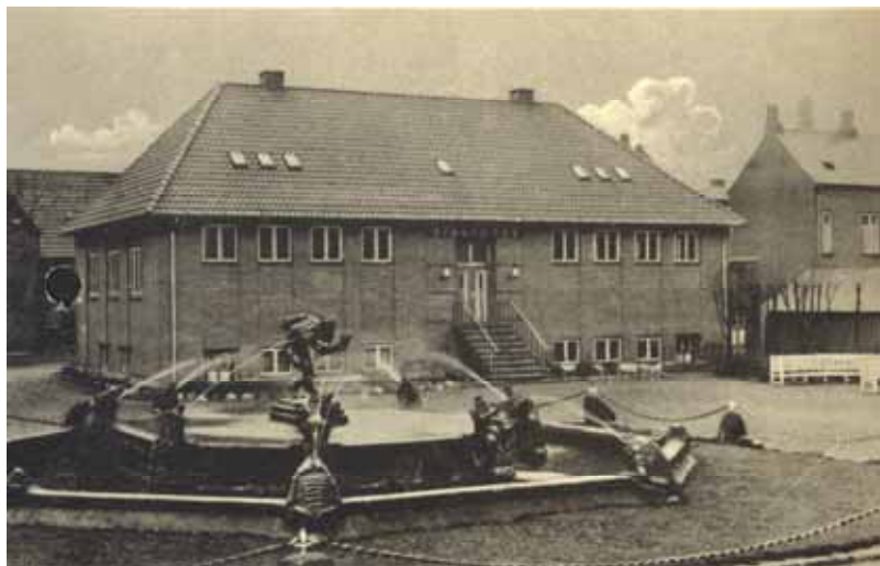
På et gammelt postkort ses Troldepringvandet og Det gamle Bibliotek, som det så ud inden Gallerigangen blev opført i 1975.