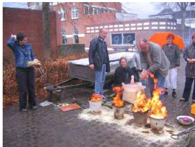
På pladsen kunne forbigående og deltagere i Store Ilddag opleve rakubrændingens flotte bål i spandene med savsmuld.

markering med den trehovedet trolde, Skov-