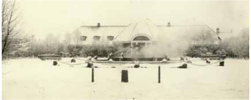
På et gammelt fotografi ses Troldepringvandet som det i sin tid så ud, da det stadig sprang året og døgnet rundt med brand varmt vand. Nede omkring 0 gr. dampede det!