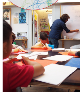
▲ 1. besøg: På tavlen tegnes der skattekort som visuelt dagsprogram. Børnene tegner med på indersiden af det bogomslag, de startede dagen med at folde.