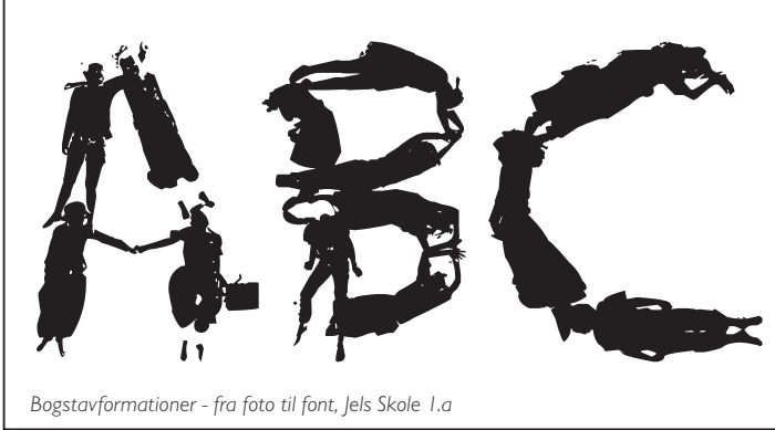
Bogstavformationer - fra foto til font, Jels Skole 1.a

forvandlede insekter fra Sydamerika. Mens børnene spiste madpakker, gættede de ivrigt med på, hvad strengen kom til at forestille, og ofte gav fortællingen anledning til (uforudsigelige) associationer fra børnene, fordi historierne fangede dem i det øjeblik, de var i. Det havde sin helt egen charme! Fremadrettet kunne det være interessant at arbejde videre med den tegnede fortælling som formidlingsgreb. Bl.a. effekten af den dramatiske opbygning i forhold til oplevelse og læring.