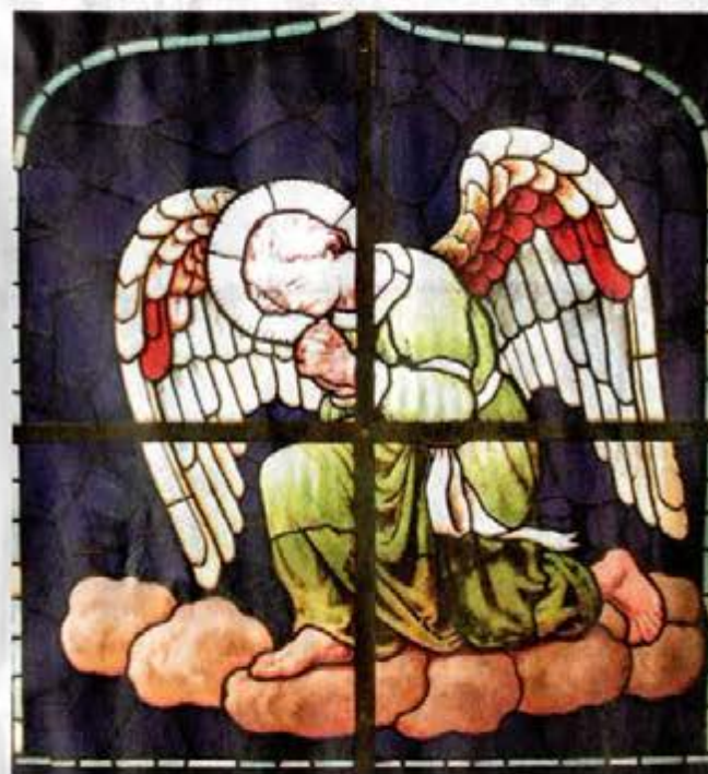
Axel Hou: Kirkerude (detalje) til Mariendal Kirke, København 1925.

Senere er han på grundige studieture bl.a. til Marburg og Köln for at studere glasmaleri og kirkeruder. Sikke skitsebøger der kom ud af det, og han fik også omsat sine studier i marken til en række dekorative kirkeruder (bl.a. i Garnisonskirken i